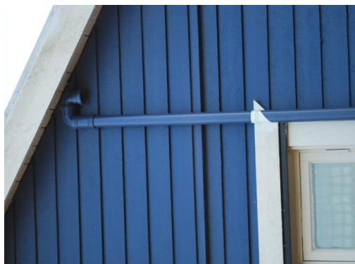
Avluftning på husvägg