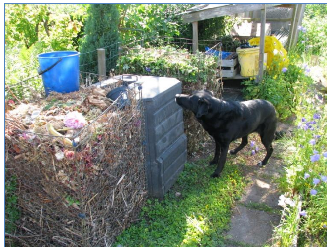
Lenas hund Sally inspekterar komposterna.