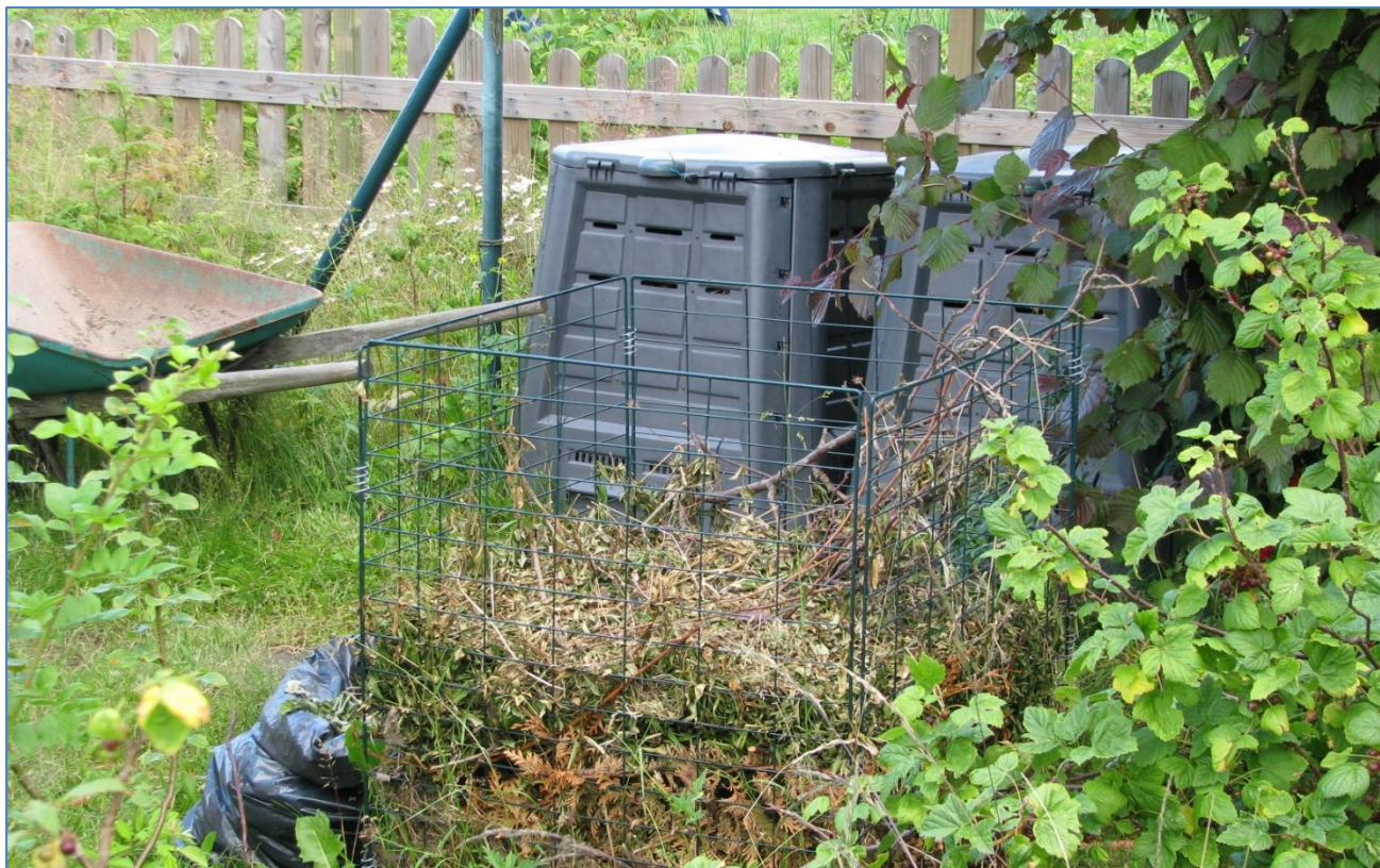
Två slutna behållare och en öppen att samla kvistar i.