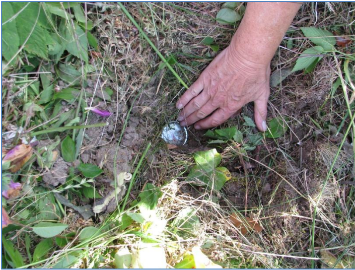
Temperaturen i Christinas kompost är 25 C.